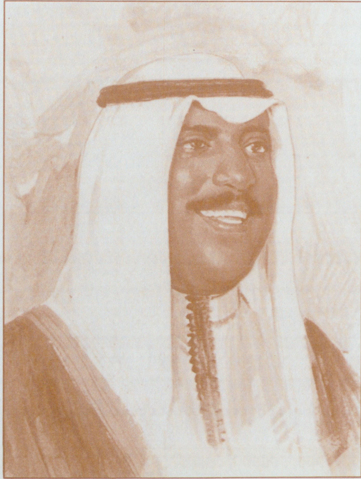
صاحب السمو وليّ العهد رئيس مجلس الوزراء الشيخ سعد العبد الله السالم الصباح